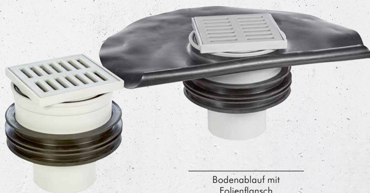
Bodenablauf mit Folienflansch

■ Einsatz in noch zu erstellenden Bodenplatten aus WU-Beton (Weiße Wanne)