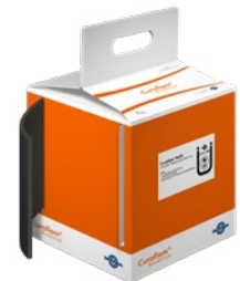
Curaflam® Rollit Box

Lieferumfang: 10 m Wickelband, 200 mm breit; incl. 30 Klebestreifen und 15 Brandschutzschildern, Einbauanleitung.