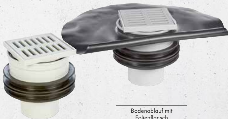
Bodenablauf mit Folienflansch

■ Einsatz in noch zu erstellenden Bodenplatten aus WU-Beton (Weiße Wanne)